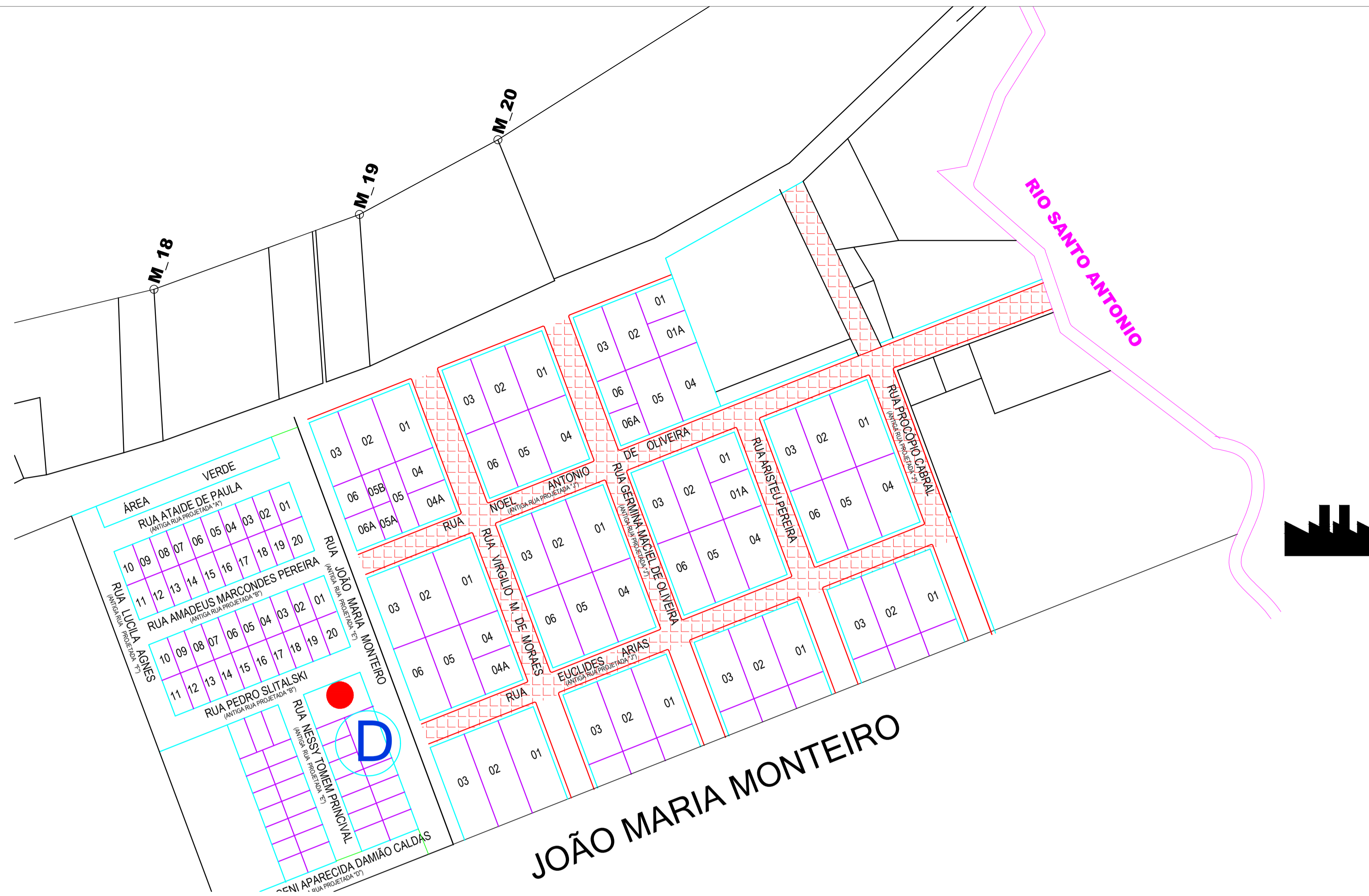
PLANTA DE SITUAÇÃO Escala: sem